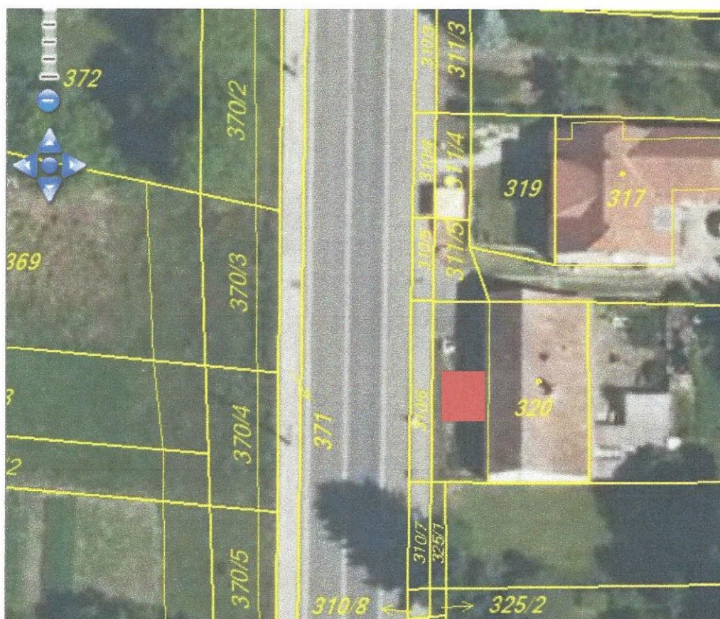
Obr. č.1 Prodejní místo na parcelních číslech 320

Vybavenost: místo není vybaveno přívodem vody ani elektrické energie