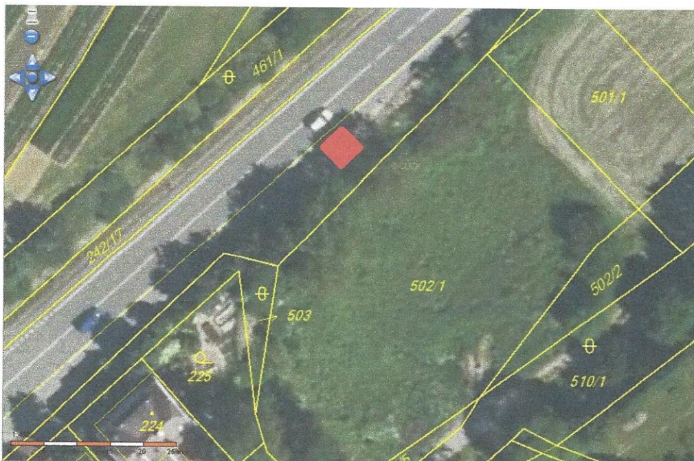
Obr. č.2 Prodejní místo na parcelním čísle 242/16